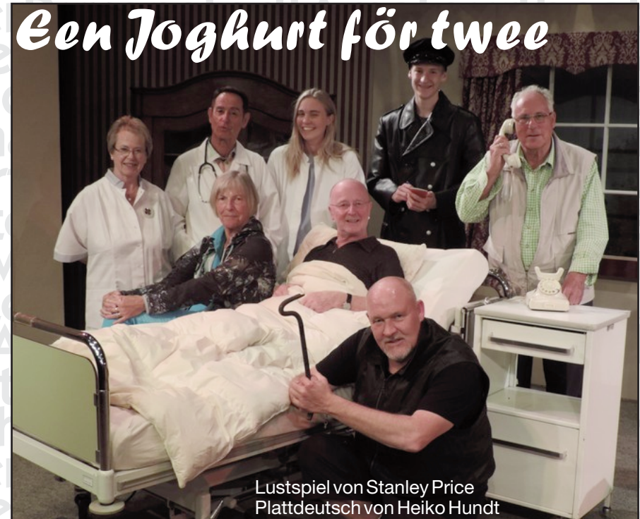
Lustspiel von Stanley Price Plattdeutsch von Heiko Hundt